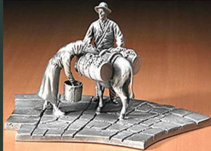
ο Νερουλάς Τα βαρέλια με το νερό φορτωμένα στην πλάτη του υπομονετικού γαϊδουράκου.